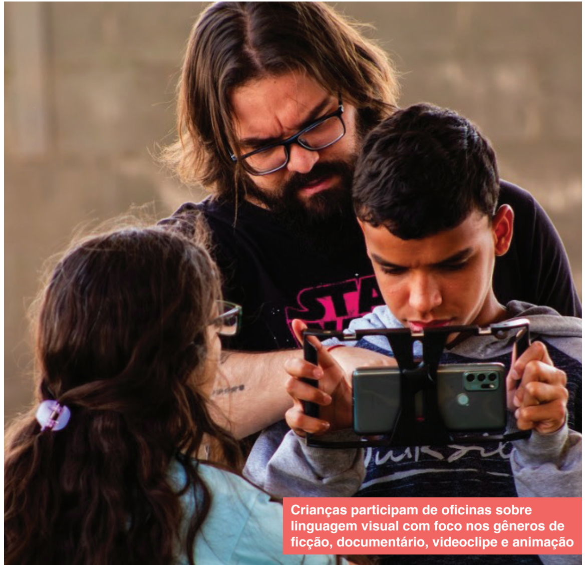
Crianças participam de oficinas sobre linguagem visual com foco nos gêneros de ficção, documentário, videoclipe e animação