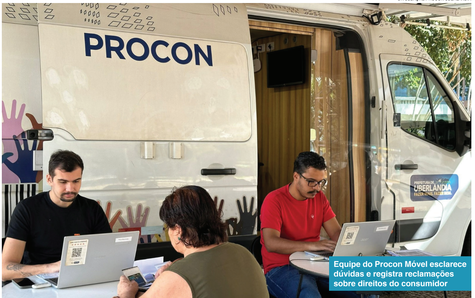
Equipe do Procon Móvel esclarece dúvidas e registra reclamações sobre direitos do consumidor