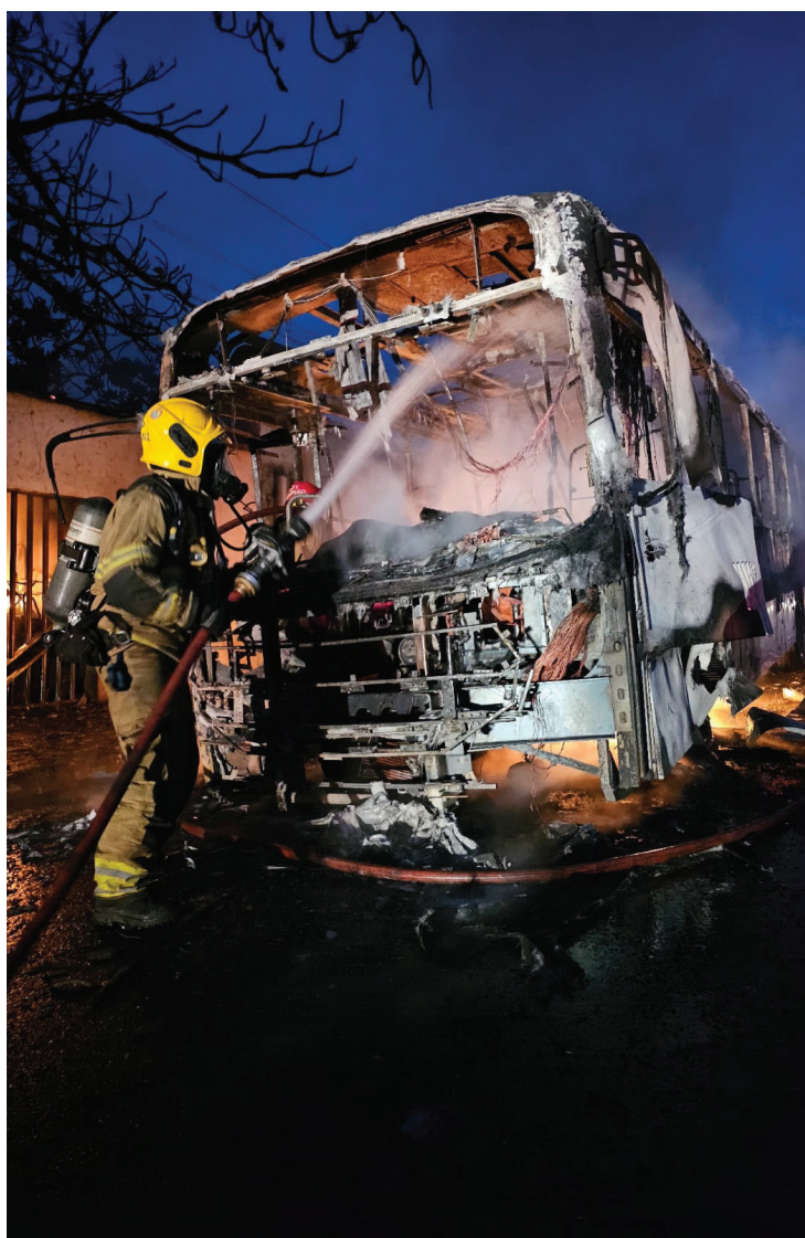
CORPO DE BOMBEIROS

CRIMINOSOS ATEARAM FOGO EM DOIS VEÍCULOS; OUTROS DOIS ENTRARAM EM CHAMAS NO TERMINAL. Página | 4